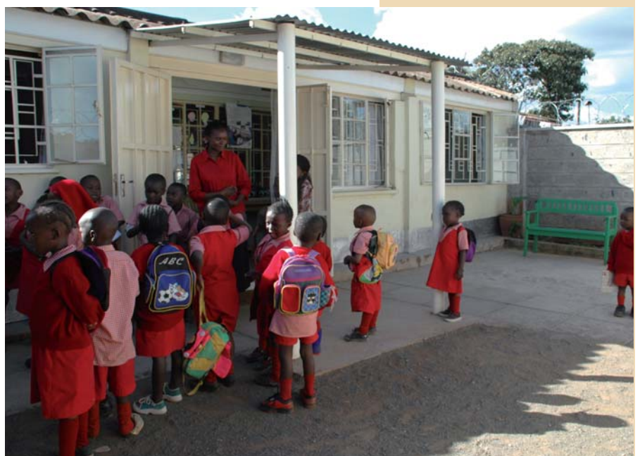
Im Kindergarten werden die Kleinen im Alter von drei bis sechs Jahren ganztägig betreut und versorgt.

Im Moment sind 90 betroffene Kinder im Alter zwischen drei und sechs Jahren im ganztägig geöffneten Kindergarten mit angeschlossener Vorschule. Dort bekommen sie ein Frühstück, Mittag- und Abendessen.