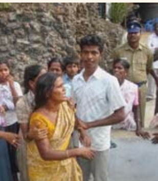
Eine verzweifelte Dalit-Frau beklagt die Gewalt.

Thittukaattur ist ein abgelegenes Dorf in der südindischen Region Chennai im Bundesstaat Tamil Nadu. Hier leben 23 Dalit-Familien in einem abgegrenzten Wohnviertel. Sie sind umzingelt von 400 Familien aus oberen Kasten, ohne deren Erlaubnis sie ihr Viertel nicht verlassen dürfen. Die Dalits sind völlig abhängig von den oberen Kasten. Sie leben auf engstem Raum, haben weder einen öffentlichen Ort, an dem sie sich treffen können, noch Straßen und nur ein einziges Licht für alle. Selbst