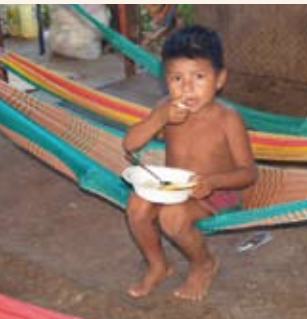
Gestrandet in Guasualito: 140 Kinder und Erwachsene des Indianer-Stammes der Makawan.